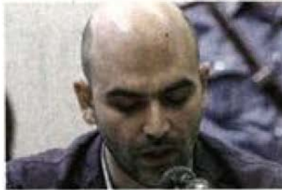
Auf der Flucht: Der Autor Roberto Saviano

Organisiert. Die Mafia ist zurück: Sky startet heute Staffel zwei seiner Kultserie „Gomorra“ (deutsch: „Gomorra“). Das Mafiaepos basiert auf einer Idee des italienischen Aufdecker-Autors Roberto Saviano, der ein gleichnamiges Buch über das organisierte Verbrechen in Italien geschrieben hat und seither streng bewacht im Untergrund leben muss. Die Serie zeigt die Machenschaften der fiktiven Mafia-Familie Savastano, die als Teil der süditalienischen Verbrecherorganisation Camorra in Neapel operiert. Neben den Konflikten mit einem anderen Camorra-Clan, internen Rivalitäten zwischen Clan-Mitgliedern und einer Führungskrise, zeigt die Handlung auch die Verstrickungen der Mafia in das Drogengeschäft und die lokale Stadtpolitik. Staffel eins endete mit einem Machtvakuum: Boss Pietro Savastano brach aus einem Gefängnisbus aus, seine Rivalen